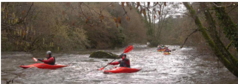
Merci à tous les bénévoles qui ont participé à l'organisation