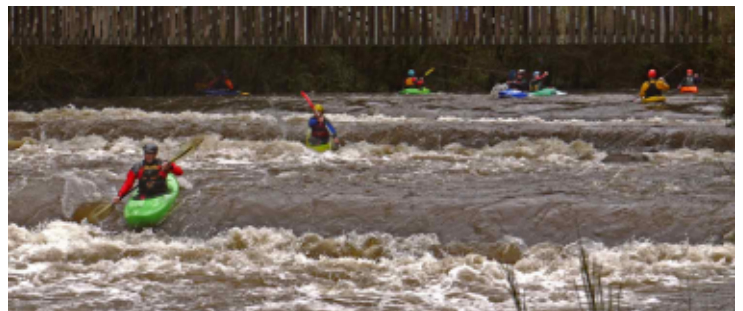
Pause café à Kernansquillec