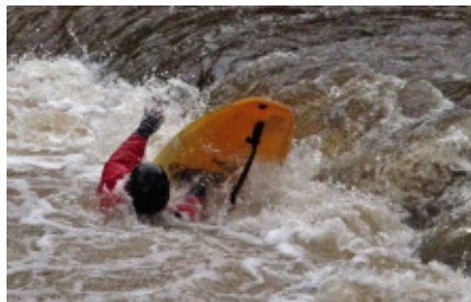
nombreux bains rafraichissants