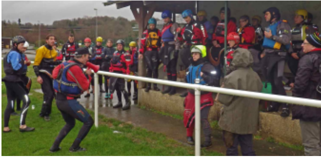
Départ de Belle-Isle avec café, chocolat et croissants