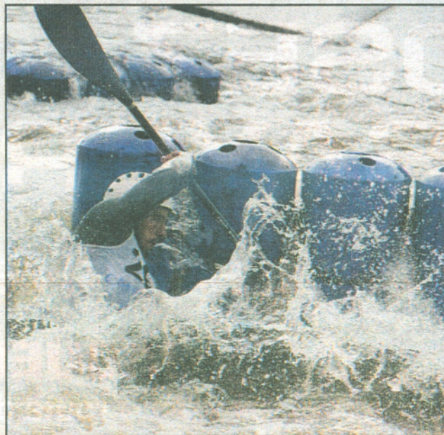
■ Vainqueur samedi, le champion olympique 2004 Benoit Peschier a manqué de rythme dimanche.